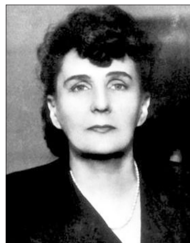
■ Zofia Nałkowska.

jako Eurydyka (Gluck), Donna Elvira (Mozart), Hrabina (Mozart), Miss Jessel (Britten), Iris (Petitgirard), Skierka (Zełeński) i in. Jest laureatką wielu konkursów krajowych i międzynarodowych oraz stypendystką Ministra Kultury i Dziedzictwa Narodowego. Obecnie występuje w Teatrze Wielkim Opery Narodowej, Operze na Zamku w Szczecinie, Operze Wrocławskiej oraz w Narodowym Forum Muzyki NFM.